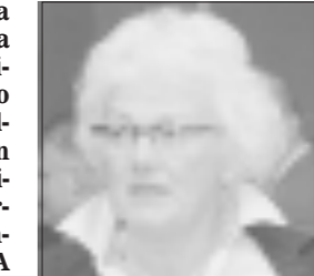
Mariann Fischer Boel