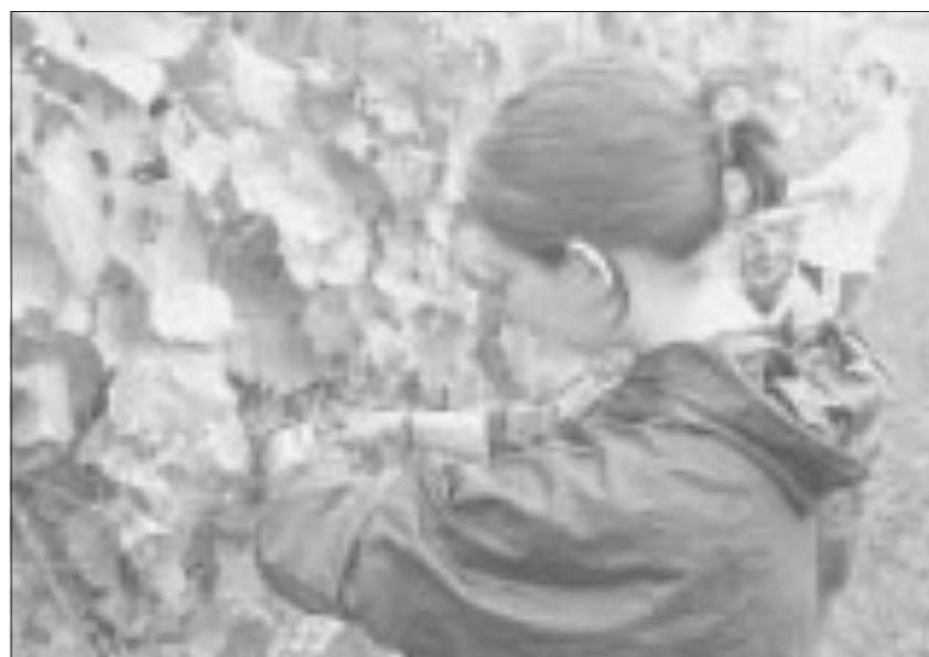
A giorni inizierà la vendemmia

meteo caratterizzato da un evento piovoso rilevante, domenica 8, e da numerose altre precipitazioni di minore entità che hanno contribuito a mantenere un livello di umidità elevato. Questa situazione tiene in allerta i viticoltori franciacortini nonostante l'ottimo livello sanitario attuale delle uve. Si evidenzia inoltre uno sbalzo termico rilevante fra giorno e notte che favorirà la definizione di un ottimo profilo aromatico del Franciacorta 2004.